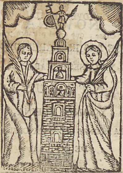
SANTA JUSTA, y Santa Rufina.